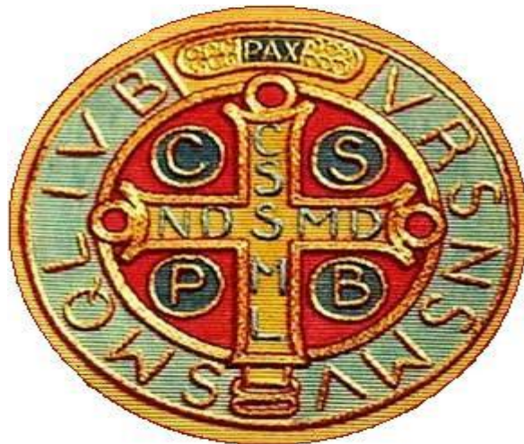
Fot. Medalik świętego Benedykta z Nursji.

Jakie znaczenie mają poszczególne symbole? Przede wszystkim, w centrum medalika znajduje się potężny, równoramienny krzyż z umiejscowionym nad nim łacińskim napisem „PAX”, czyli „Pokój”. To wyraźne odniesienie do Listu do Efezjan, w którym św. Paweł pisze: „Ale teraz w Chrystusie Jezusie wy, którzy niegdyś byliście daleko, staliście się bliscy przez krew Chrystusa. Jezus, bowiem jest naszym pokojem. On, który obie części uczynił jednością, bo zburzył rozdzielający je mur – wrogość. W swym ciele pozbawił On mocy Prawo przykazań, wyrażone w zarządzeniach, aby z dwóch stworzyć w sobie jednego nowego człowieka, wprowadzając pokój, i tak jednych, jak i drugich znów pojednać z Bogiem w jednym Ciele przez krzyż” (Ef 2,13-16).